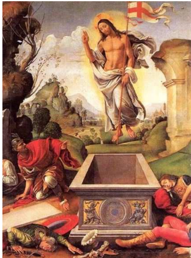
Raffael (1483 bis 1520)

Wir wünschen allen Leserinnen und Lesern ein frohes Osterfest.