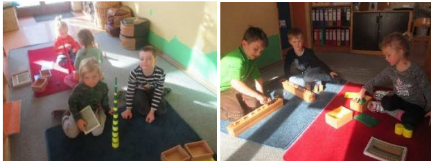
Das Team der Kindertagesstätte „Auerbergzwerge“

Die schon lange gewünschten Montessori-Materialien (hölzerne und bunte Einsatzzylinder, Hunderterbrett, metallene Einsätze, konstruktive Dreiecke, usw.) konnten nun angeschafft werden. Unsere „Auerbergzwergekinder“ haben sich sehr darüber gefreut und die hochwertigen Materialien sind bis heute jeden Tag im Einsatz. Das gesamte Team und unsere Kinder bedanken sich ganz herzlich bei der Firma KTW Kunststoff-Medizintechnik für die großzügige Spende.